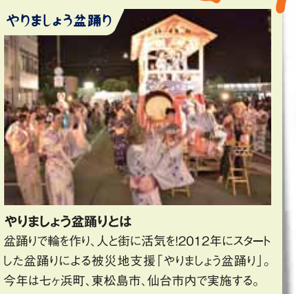
やりましょう盆踊りとは 盆踊りで輪を作り、人と街に活気を!2012年にスタート した盆踊りによる被災地支援「やりましょう盆踊り」。 今年は七ヶ浜町、東松島市、仙台市内で実施する。

午前~夕方までは、家族みんなで楽しめるパフォーマンス エリア。まちぐるのパフォーマンス仙台による大道芸、「仙台 の昔を伝える紙芝居づくり・上演実行委員会」による紙芝 居などを実施。夜は祭り櫓が登場し、仙台七夕まつりの定 番曲「七夕おどり」を中心とした盆踊り曲をみんなで踊りま す。飛び入り参加大歓迎! 踊って踊って、盛り上がりよう!